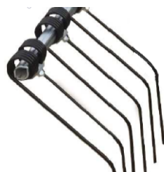
Lemon tubed profile