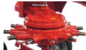
Gearbox Made in Italy oil bathed