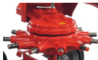
Gearbox Made in Italy oil bathed mechanical and hydraulic height control