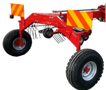
Pivoting rear trailer wheels

La GD à deux rotors est aujourd'hui la machine la plus raffinée pour la production de foin, avec son travail précis et son traitement parfait des chaumes. Les opérations de travail sont obtenues grâce à la disposition différente des bras des supports des rotors qui, agissant sur un guide à cames en position fixe, déterminent le mouvement des râteaux rotatifs. L'andaineur FAZA est construit avec un bain d'huile pour les rotors à 9 ou 11 bras et l'attaque à trois points DIRECTION, offre la possibilité d'atteindre 7,00 et 8,00 mètres de travail total..