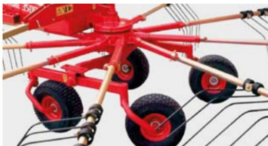
Balancing wheels available on demand

La gamme de faneuses comprend les faneuses G8 et G9, des outils robustes et agiles, polyvalents dans leurs fonctions, précis dans leurs mouvements, pour un travail parfait et un traitement optimal du fourrage.