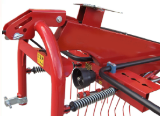
Articulated third point hitch

Los rastrillos hileradores GRS son especialmente robustos, con grandes anchuras de trabajo y altas velocidades de avance para obtener un alto rendimiento y una excelente calidad del producto.