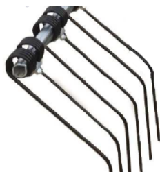
Lemon tubed profile